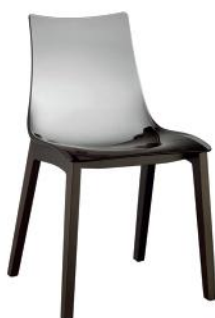
2805 FW 183