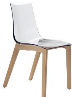
2805 FN 100