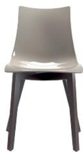
2806 FW 315